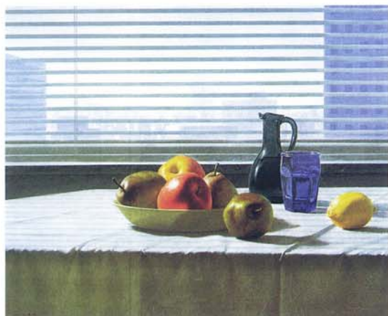
(図3) 参考作品 三浦明範「STRIPE MORNING」F 15号 同じく、ブラインド越しの光と影をモチーフに。